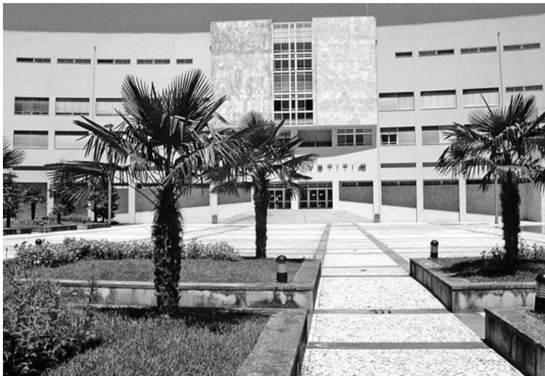
Julgamento decorreu no Tribunal de Braga

O marroquino não compareceu à audiência de julgamento, efectuada no mês findo, pelo que foram apenas recolhidos depoi-