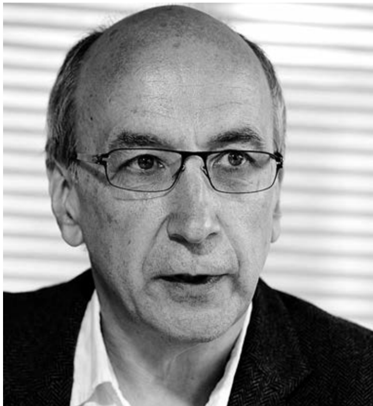
O economista britânico Richard Blundell, galardoado com a cátedra Lloyd Braga

do uma referência mundial na análise do mercado de trabalho e da reforma de políticas públicas e já presidiu à European Economics Association, à Econometric Society e a Society for Labor Economics, entre outros cargos. Recebeu, ainda, diversos doutoramentos ‘honoris causa’, nas universidades de St. Gallen,