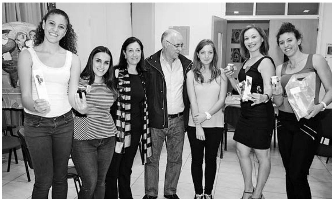
Grupo que representou o Agrupamento de Escolas da Póvoa de Lanhoso

O próximo encontro do projecto 'Biodiversidade dos rios' está agendado para Março de 2014, com deslocação a Istambul Turquia. O 'Comenius' é financiado pela União Europeia e está vocacionado para o intercâmbio entre escolas europeias.