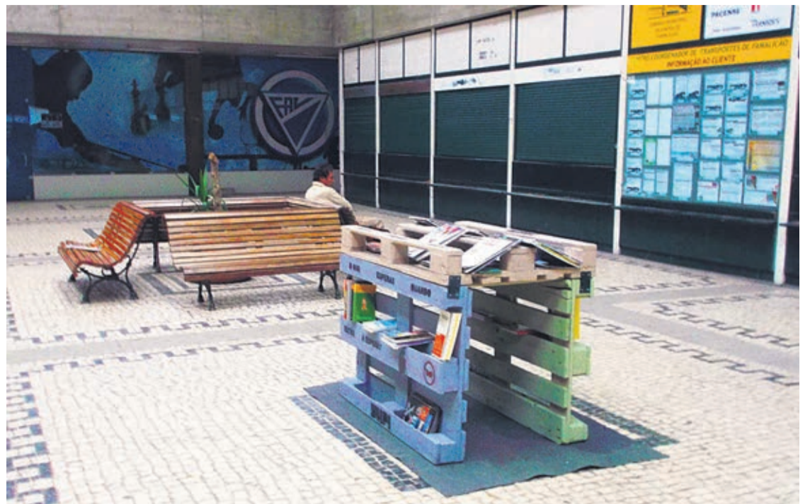
Banca de livros está instalada em plena Central de Camionagem

Os livros e revistas foram recolhidos e oferecidos, num projec-