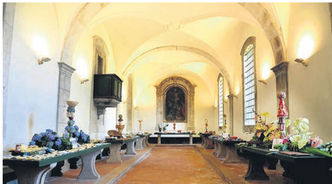
Exposição sobre Solares de Portugal e Casas de Campo está patente em Ponte de Lima

Esta mostra visa prolongar os trabalhos que decorreram no V Encontro Nacional de Turismo de Habitação e TER que a TURIHAB promoveu, dando a conhecer a sua actividade ao longo