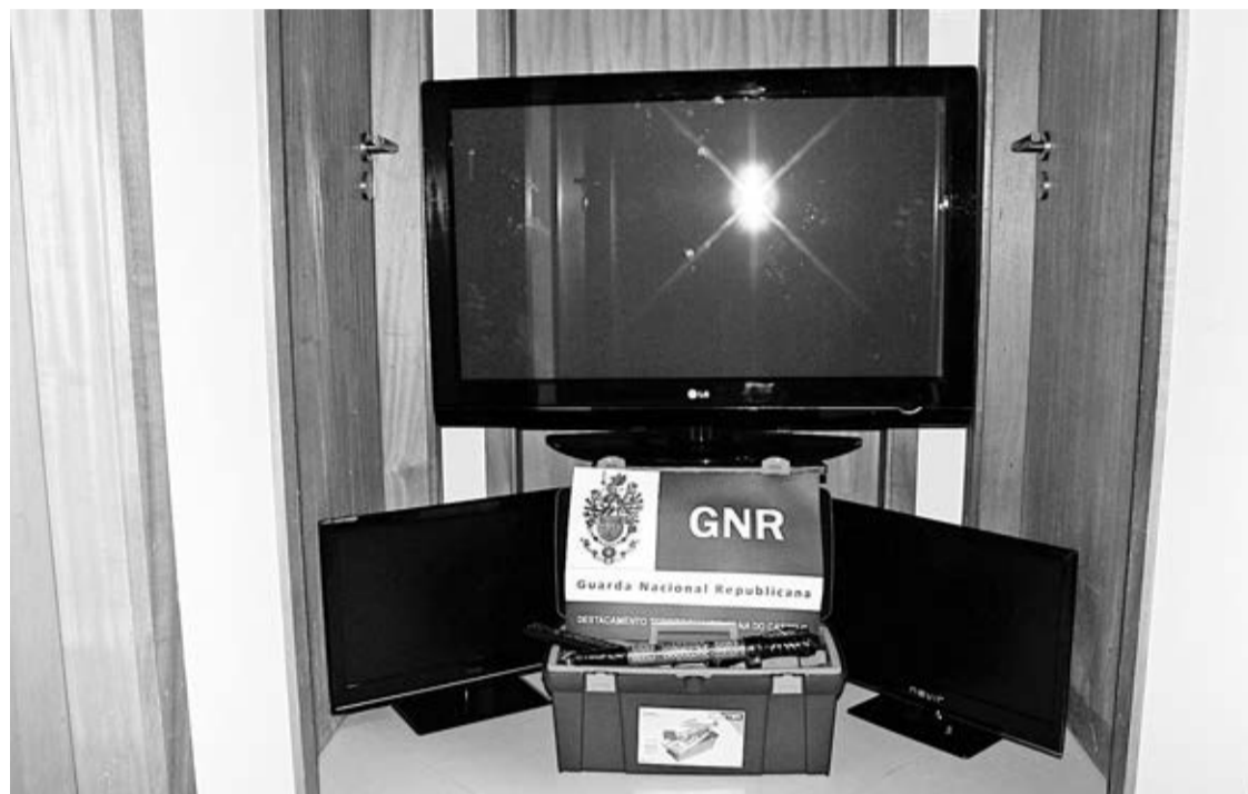
Material recuperado pelo NIC de Viana do Castelo e que tinha sido furtado em residência em Alvarães

Na continuação das diligências, o NIC de Viana do Castelo efectuou quatro buscas - duas em residências, uma em estabelecimento comercial e outra em veículo automóvel - nas localidades de Alvarães e Chafé, con-