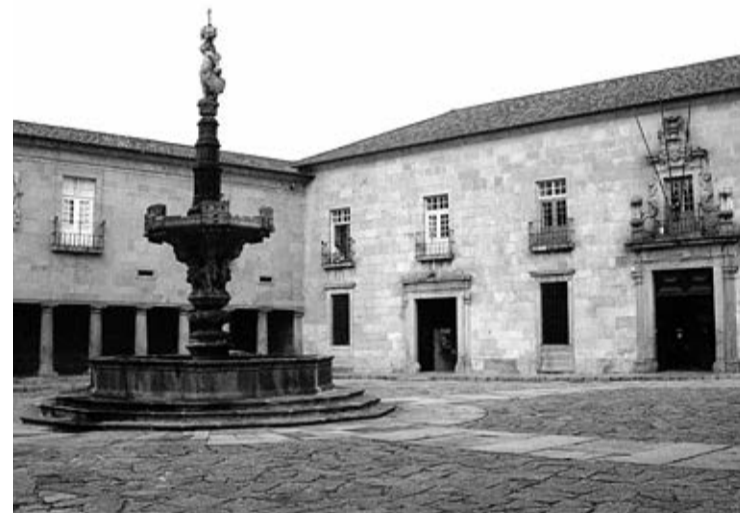
Reitoria da Universidade do Minho, no Largo do Paço

Serão interpretadas obras de Johannes Brahms e Maurice Ravel.