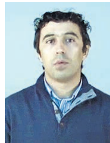
Presidente da direcção do CART

Face a estes resultados e a este grande início de campanha do taekwondo bracarense, as expectativas não poderiam ser mais altas para os próximos compromissos internacionais.