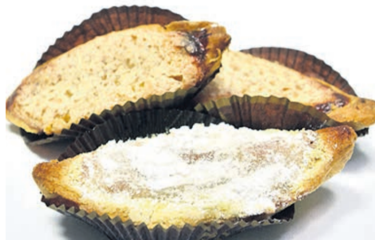
Pastelaria Cais Novo apresenta pastel de feijão

'Tardes Gulosas' prolonga-se até o dia 29 de Novembro e envolve mais de 20 pastelarias de Braga, Vila Verde, Amares e Terras de Bouro.