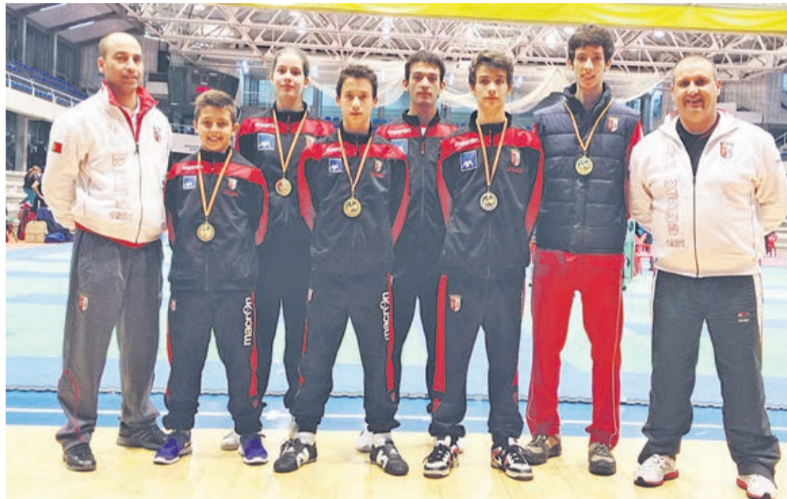
Atletas bracarenses que estiveram em competição em Pontevedra e arrecadaram cinco medalhas

OURO, PRATA E BRONZE , o Sporting de Braga teve um início de época em grande no taekwondo com a conquista de cinco medalhas em Pontevedra.