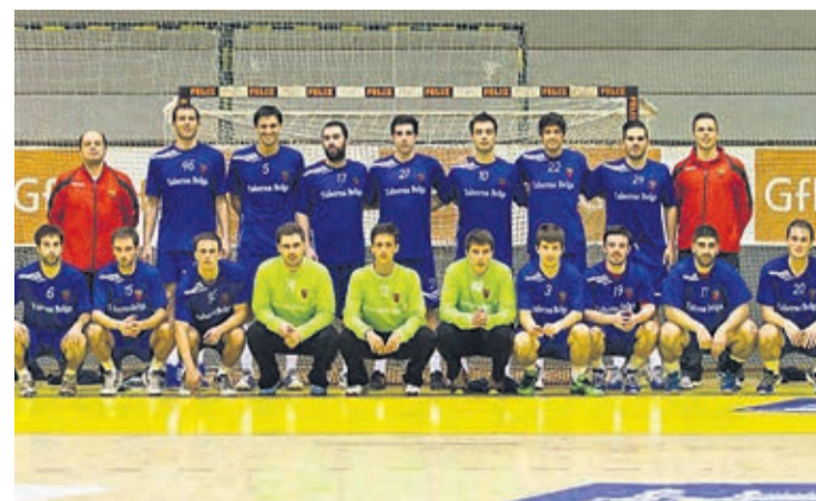
Equipa do Arsenal Devesa Andebol

Aos vencedores dos jogos da segunda eliminatória vão juntar-se os clubes da I Divisão, para disputar a próxima ronda da competição, cujos jogos serão a 7 de Dezembro próximo.