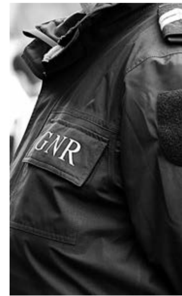
GNR de Riba d' Ave fez duas apreensões

Recorde-se que ainda durante o fim-de-semana, e também em Bairro, Vila Nova de Famalicão, a GNR, desta feita através do Núcleo de Investigação Criminal (NIC) do Destacamento Territorial de Barcelos, apreendeu haxixe suficiente para cerca de 400 doses individuais. O detido foi ontem a tribunal.