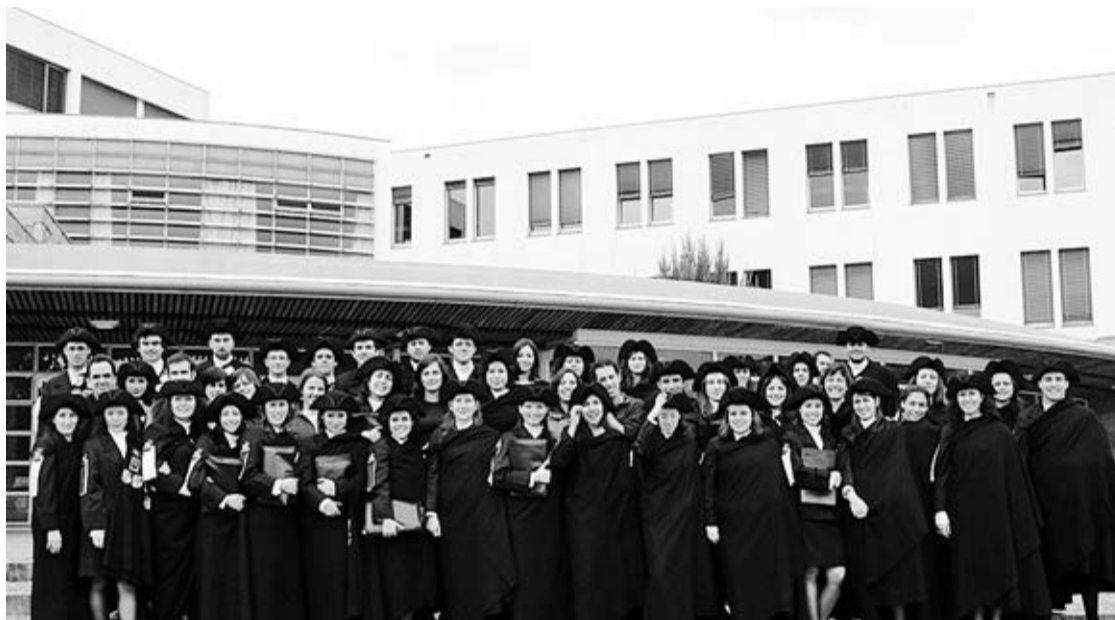
Licenciados em Medicina pela Universidade do Minho destacam-se no acesso às especialidades médicas