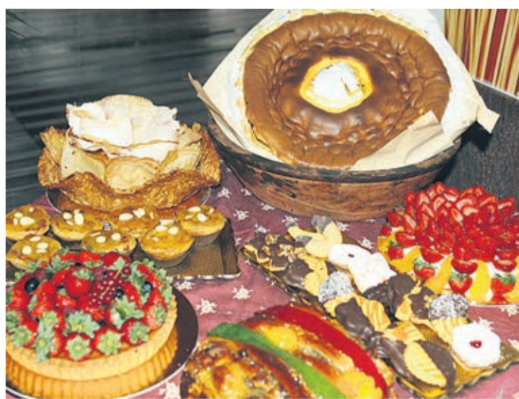
Algumas das iguarias apresentadas pela Pastelaria Nobreza

feito com os produtos que se colhem nessa altura, nomeadamente, a chila e a amêndoa", revelou a supervisora, assegurando que "é um doce conventual delicioso". E a ter em conta a procura, o pastel já conquistou os muitos clientes da Nobreza, que ontem durante a tarde tiveram oportunidade de beneficiar da campanha 'leve dois e pague um'. "Esta foi uma ideia fantástica. Começámos ao meio-dia e em duas horas vendemos 360 unidades do pastel de S. Miguel", frisou. Mas não é só o pastel de S. Miguel que deixa os muitos clientes de 'água na boca'. A Nobreza prima por apresentar todos os dias uma montra de fazer 'cres-