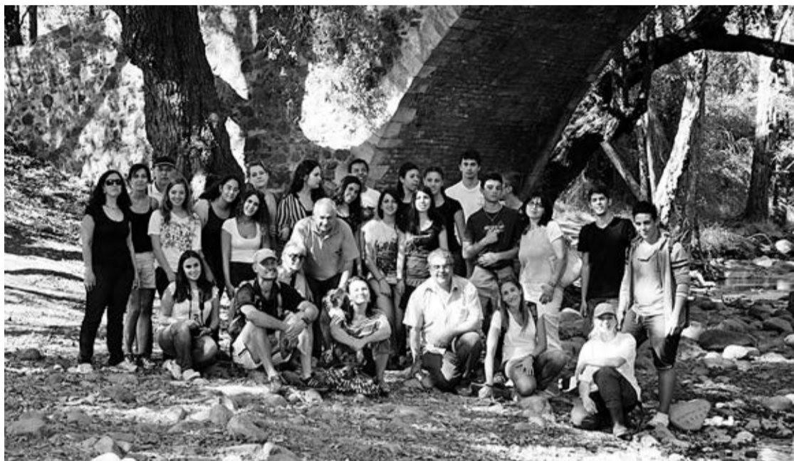
Parceiros reunidos junto a um rio no sul do Chipre

"Para além de permitir planear o trabalho, este primeiro encontro internacional foi fundamental para estabelecer laços entre as escolas participantes e para fortalecer dois dos pilares fundamentais do projecto que são o intercâmbio cultural/pedagógico